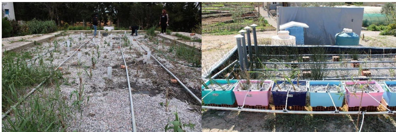
Photo 1. La station de phyto-épuration de Jouggar, Zaghuan. Photo 2. Station pilote de phyto-épuration à Sidi Amor.

Afin d'assurer une formation complète, de la théorie à la pratique, des conférences techniques ont été données, accompagnées d'exercices pratiques sur la conception de plantes de phytodépuration réalisés en petits groupes. Tout le matériel fourni pendant l'atelier de formation est disponible à l'adresse suivante: https://www.tresorprojet.eu/event/atelier-de-formation/