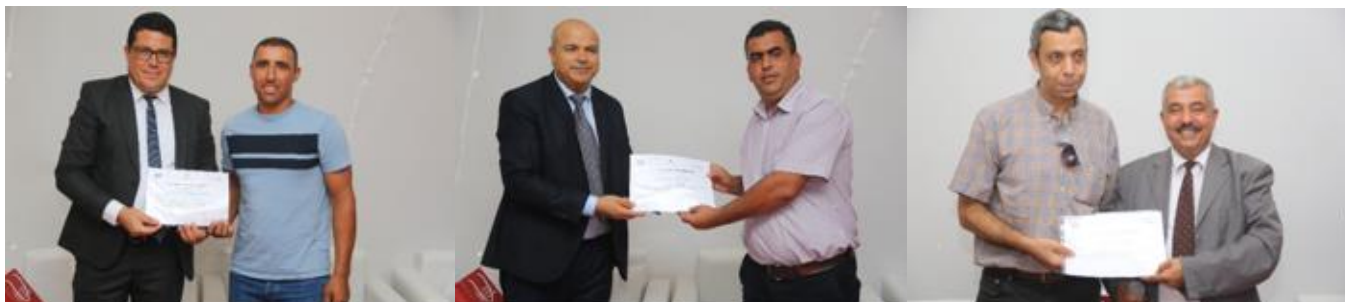
Photo 3. Quelques moments de la journée de clôture du 31 août 2023 en présence du gouverneur de Nabeul, avec la distribution des certificats aux participants et l'inauguration des filtres plantés de démonstration à Nabeul (Tunisie).