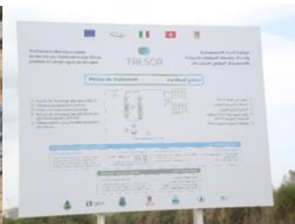
Photo 4. Photo de groupe, panneau d'information et filtres plantés à Nabeul (Tunisie).