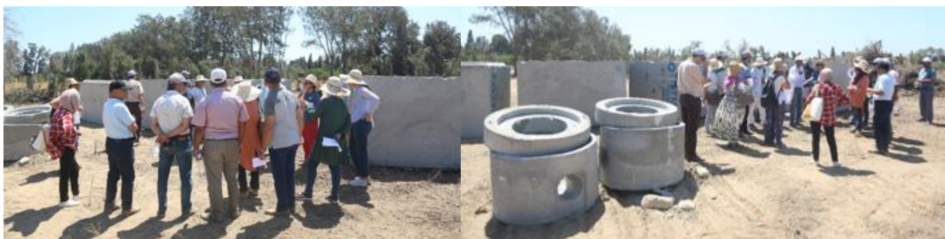
Photo 1. Quelques moments de l'événement de formation organisé à Nabeul (Tunisie) du 13 juillet au 31 août 2023 avec les participants qui observent les différentes phases de construction de la station de démonstration de filtres plantés pour les eaux usées et les boues.

Une vidéo de 7 minutes a été réalisée pour accompagner l'événement, montrant les différentes étapes et les interviews des participants (photo 2).