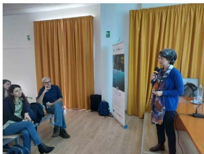
Photo 1. Quelques moments de l'événement de formation organisé à Modica (RG, Italie) les 15 et 16 décembre 2022 à l'Institut d'État professionnel "Principi Grimaldi": conférences et atelier de conception.