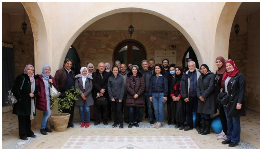
Photo 3. Groupe de participants tunisiens à la formation.